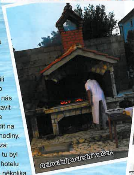
Grilování poslední večer.

Tak to také bylo. Dopoledne se bálo, připravovalo a vyklízely se pokoje. Když bylo vše nachystané, tak si všichni ještě užívali sluníčka a krásných chviliek u moře a bazénu.