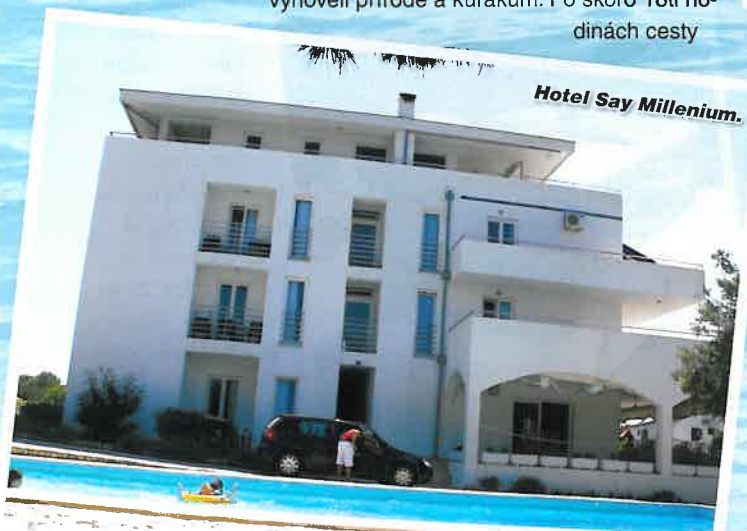
Hotel Say Millenium.

jsme před sobotním polednem dorazili do prosluněného letoviska. Tady na všechny čekal hezký penzion s apartmány a velkým bazénem na zahradě. U bazénu se trávilo spoustu času a zažila velká legrace.