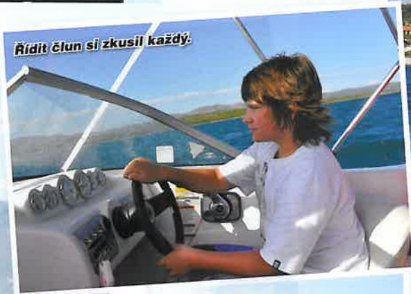
Rídit člun si zkusil každý.

Dny a večery utíkaly jeden za druhým jako voda a najednou tu byl poslední večer. Na ten nám v hotelu uspořádali slavnostní večeri o několika chodech. Na pořad se dostaly místní rybí speciality, steaky a další jiné dobroty. K jídlu pěkně vyhrávala kapela a všem bylo fajn a snažili se nemyslet na to, že druhý den se budou muset sbalit a vyrazit zpět k domovu.