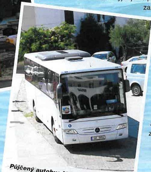
Půjčený autobus Mercedes