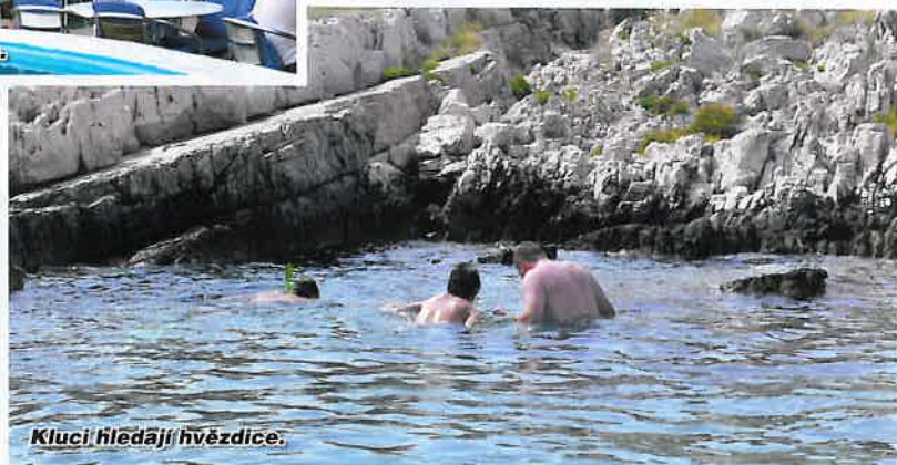
Kluci hledají hvězdice.