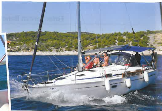
S kapitánem Milou před jízdou na motorovém člunu.