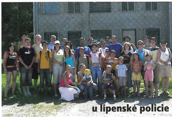
u lipenské policie